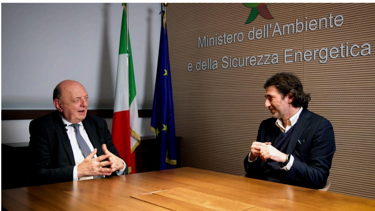
Roma, 29 gennaio

Presso la Sala Zuccari del Palazzo Giustiniani, sede del Senato della Repubblica, si è tenuto l'evento organizzato da Assocostieri intitolato “ Il GNL come Carburante della Transizione: prospettive per il settore marittimo e terrestre ”.