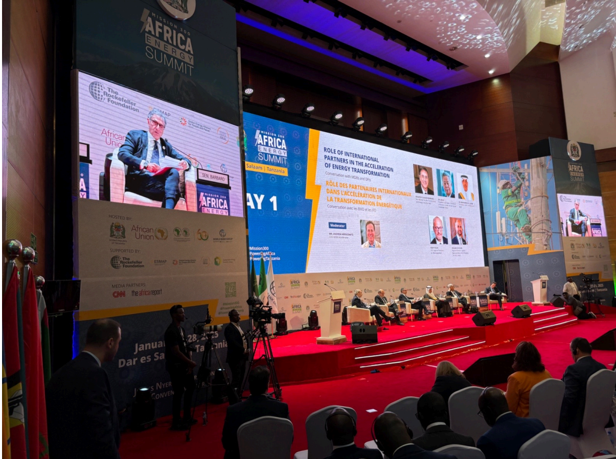
Dar es Salaam, 27 gennaio

Nel corso dell’Africa Head of State Energy Summit, l’Italia ha confermato il proprio sostegno al programma “Mission 300”, l’iniziativa della Banca Mondiale e della Banca Africana di Sviluppo che punta a garantire l’accesso ad elettricità pulita a 300 milioni di persone nell’Africa Sub-sahariana entro il 2030.