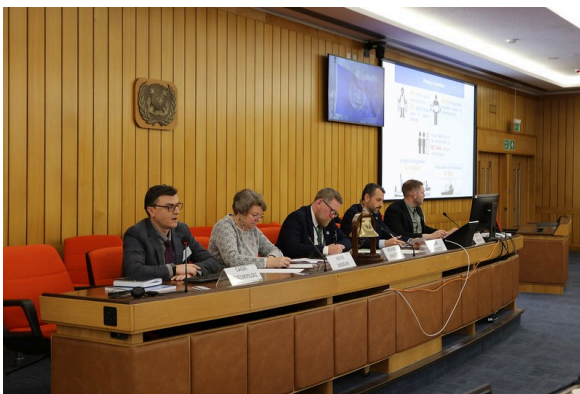
London, 23-24 January