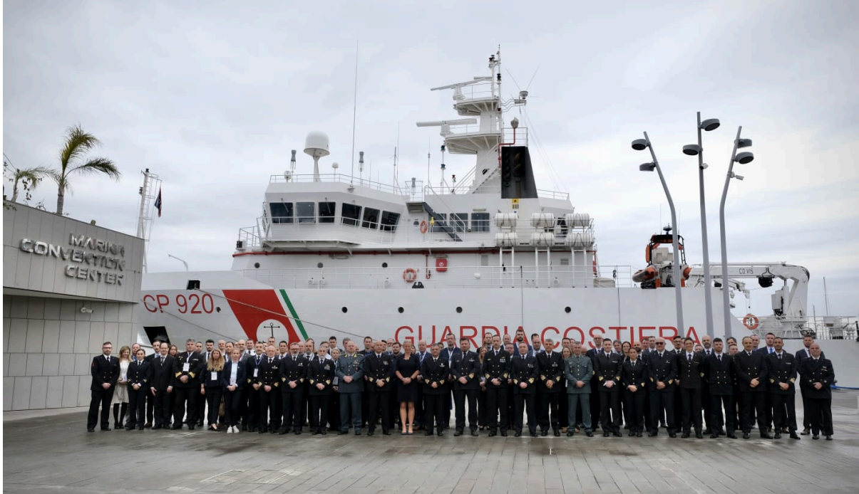
Palermo, 30 gennaio

Si è concluso il Workshop dal titolo “ Advanced technologies and AI for the sea: innovations in fisheries control activity ”, tenutosi nei giorni 29 e 30 gennaio, presso il Marina Convention Center, nella splendida cornice del molo trapezoidale. L'evento ha visto la partecipazione 90 rappresentanti, provenienti da oltre 21 Paesi e 4 Agenzie europee.