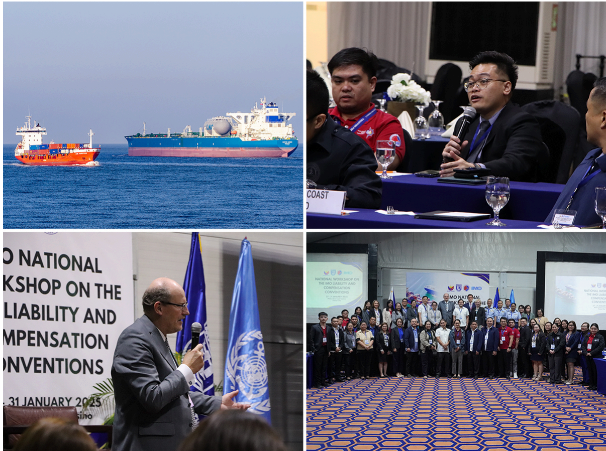
Manila, 27- 31 January

A national workshop in Manila, Philippines (27–31 January) aims to boost the understanding and implementation of IMO liability and compensation regime , in particular the 2010 HNS Convention, 2001 Bunkers Convention, and 2007 Nairobi Wreck Removal Convention.