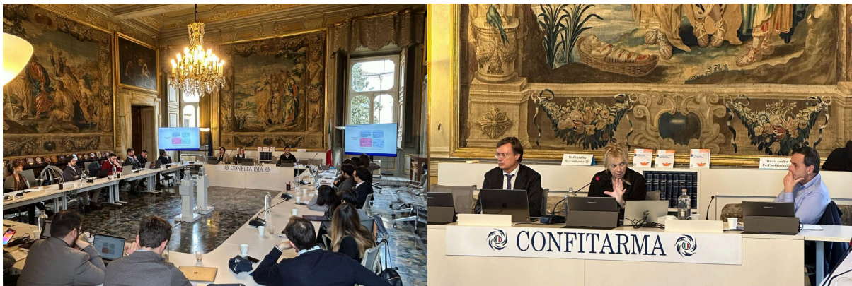
Roma, 28/29 marzo

Il 28 e 29 marzo si è svolto il quinto weekend del Master Executive in Shipping Management, interamente dedicato alla sostenibilità nel settore marittimo.