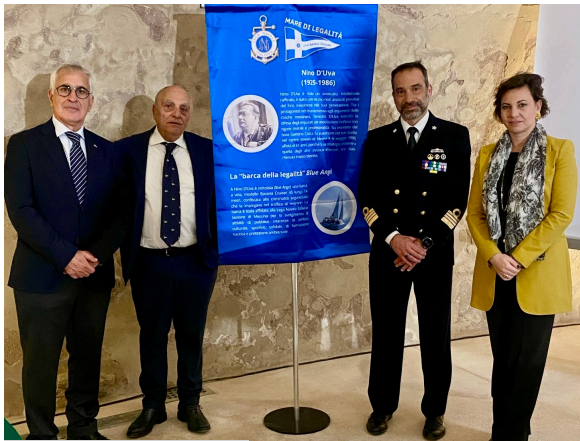
Messina, 30 marzo