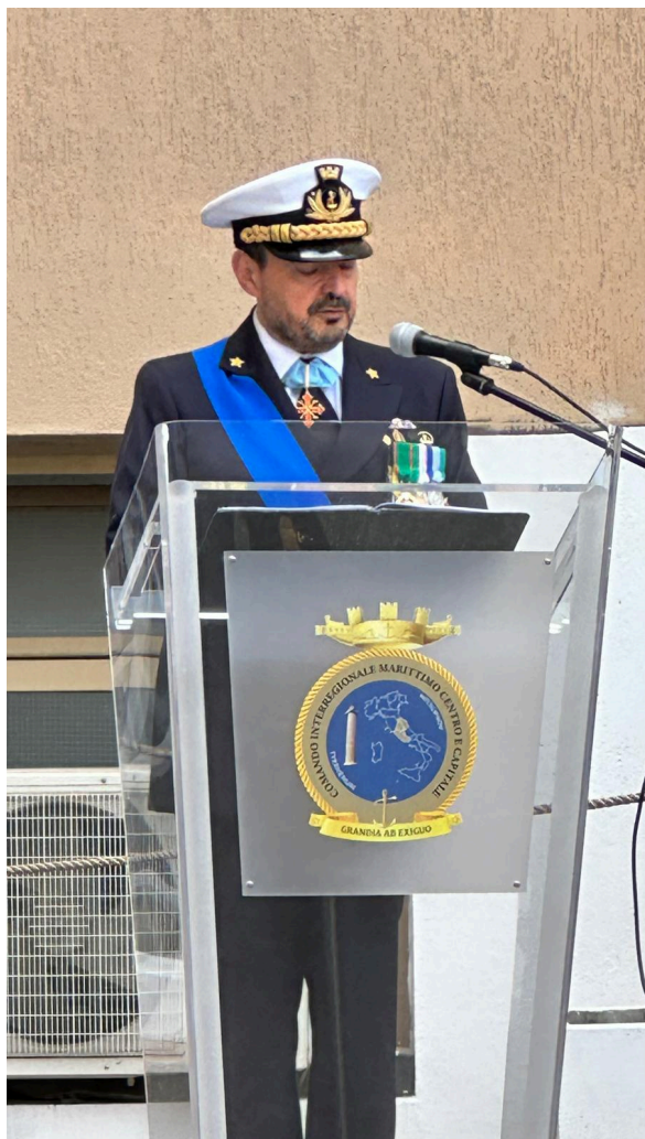
Roma, 9 maggio