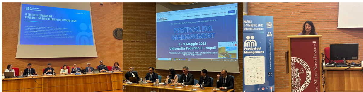
Napoli, 8 maggio

Si è svolta a Napoli due giorni del Festival del management intitolata “Deep Blue: le interconnessioni tra il Blue profondo dello Spazio e Oceani” e organizzata dalla Società Italiana di Management.