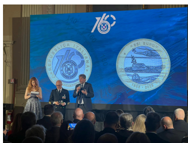
Firenze, 8 maggio