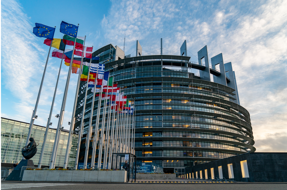
Strasbourg, 13 May

The proposed changes to the EU carbon border adjustment mechanism (CBAM) are part of simplification efforts to reduce the administrative burden for SMEs and occasional importers.