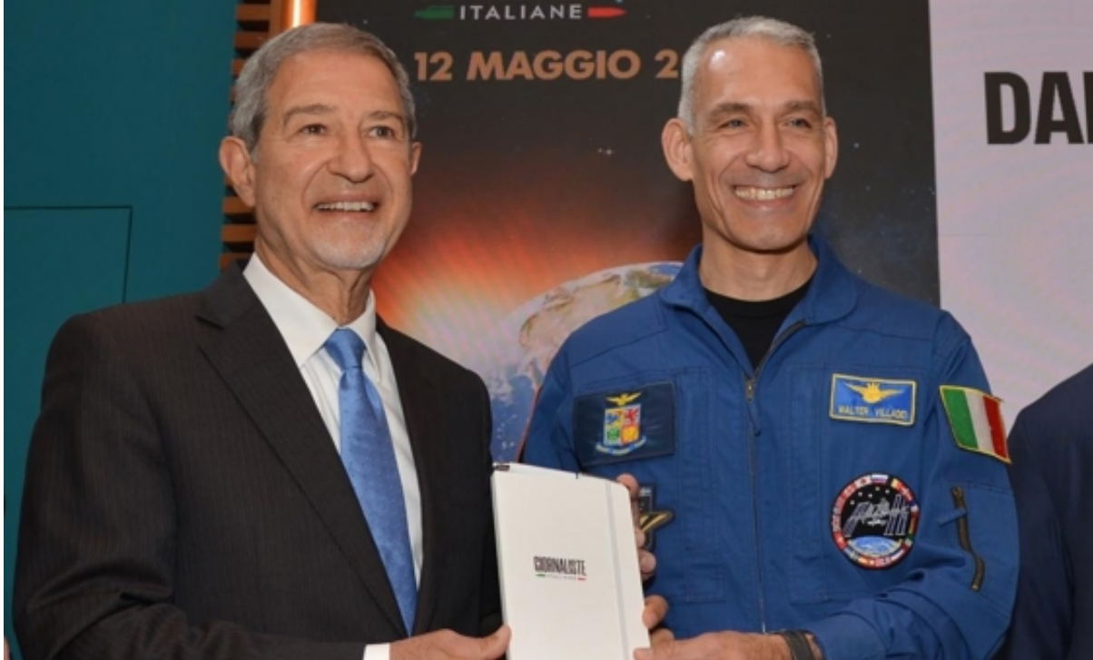
Roma, 12 maggio

"Sulla dimensione spaziale e subacquea l'Italia nei prossimi anni potrà giocare una carta importante sul piano della credibilità internazionale, della crescita scientifica e tecnologica. Il governo Meloni ha finanziato con un 1,1 miliardi di euro un programma spaziale denominato 'Iride' che consente dallo spazio, attraverso radar e satelliti, di intercettare in tempo utile ogni mutamento climatico: questo significa dare in tempo l'allerta alla popolazione interessata a quel determinato fenomeno e quindi mettere ognuno nelle condizioni di poter adottare la condotta più appropriata per mettersi in salvo. Questo ci consente di poter consolidare la prevenzione non strutturale, che non può prescindere dalla prevenzione strutturale, che significa mettere in sicurezza i fiumi, consolidare gli argini, creare casse di espansione, evitare di tombinare i fiumi e le aste fluviali.[...]