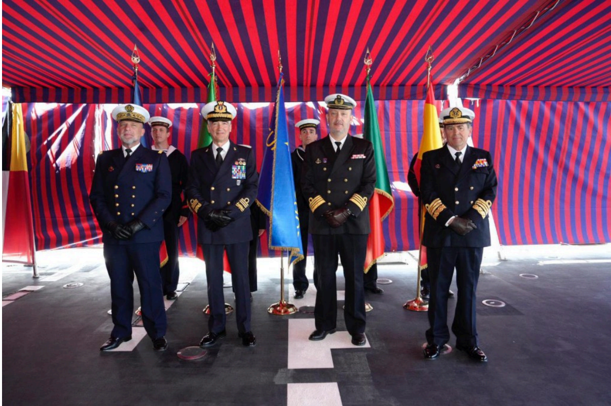
Civitavecchia, 15 May

Today marks the 30th anniversary of EUROMARFOR, the multinational European maritime force created in 1995 to promote security and cooperation in the Mediterranean and beyond.