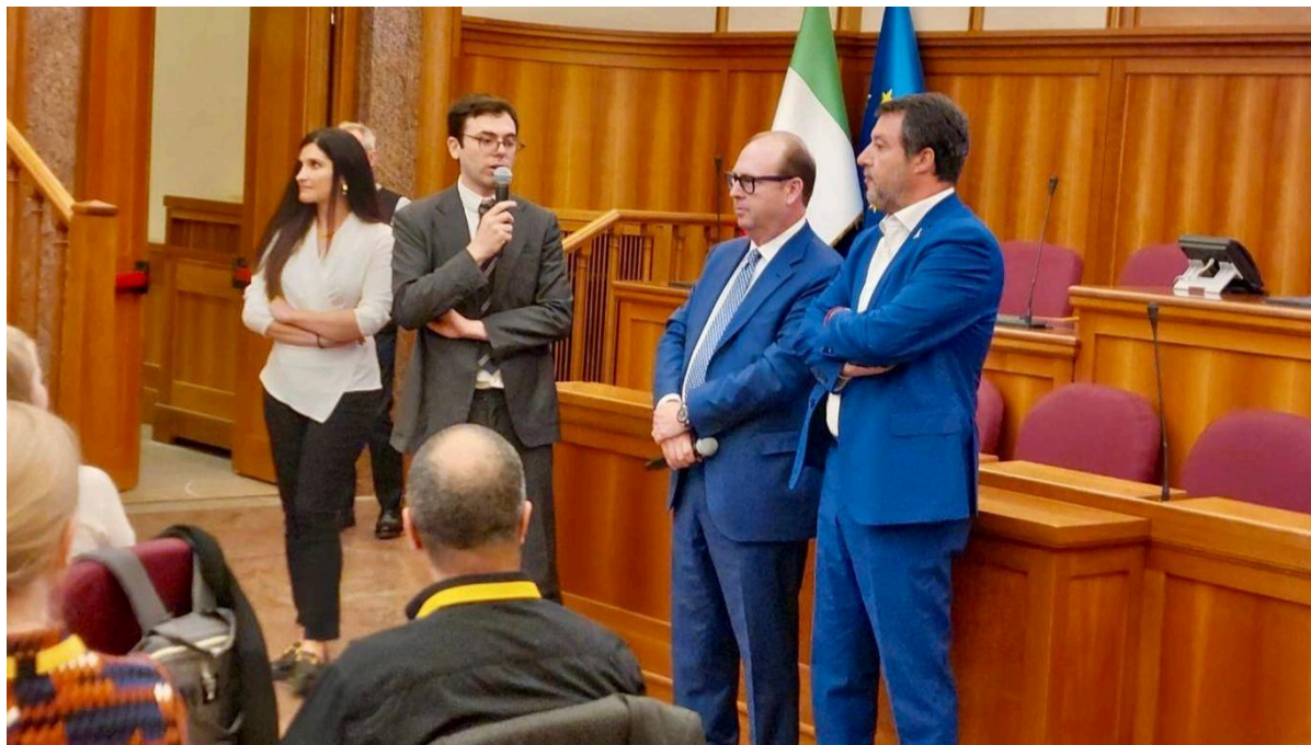
Roma, 12 e 13 maggio

Il 12 e 13 maggio 2025 si è tenuta la riunione di Comitato del progetto europeo eFTI4EU. L'evento, organizzato dal Ministero delle Infrastrutture e dei Trasporti e RAM Logistica Infrastrutture e Trasporti ed ospitato nella prestigiosa sala Parlamentino del MIT, ha visto l'apertura dei lavori da parte del Sen. Matteo Salvini, il quale ha accolto con molto entusiasmo l'iniziativa ricordando quanto il MIT sia impegnato in prima linea sul tema della digitalizzazione dei trasporti.