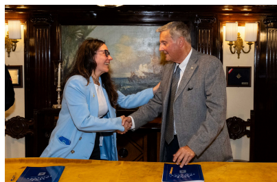
Palermo, 10 maggio

È stato siglato a bordo del Vespucci in sosta a Palermo, tappa del Tour Mediterraneo 2025 della nave scuola della Marina Militare, l'accordo di collaborazione tra il Ministro per le Disabilità Alessandra Locatelli e la Lega Navale Italiana rappresentata dal Presidente nazionale, l'ammiraglio di squadra Donato Marzano.