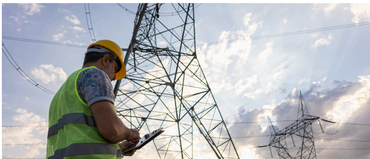
Milano, 15 maggio