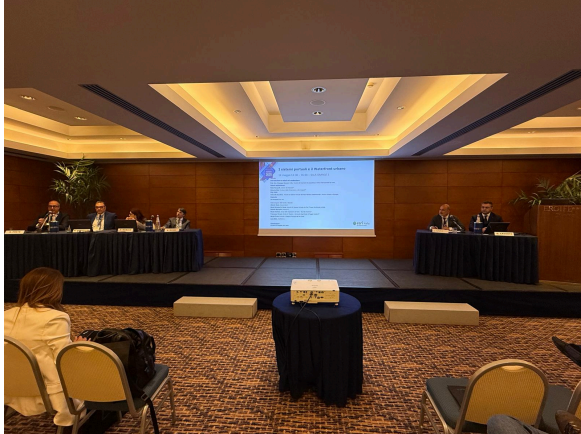
Roma, 14 maggio