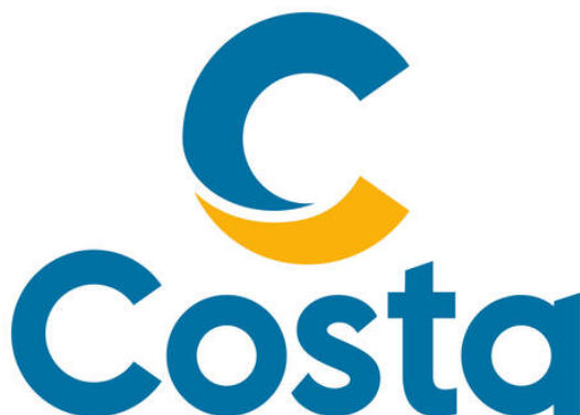
Genova, 9 maggio

Nell'ambito di un piano avviato nel 2021, la flotta Costa è stata oggetto di un completo restyling. Tutte le navi sono state o sono in fase di refit per adattare gli ambienti e i servizi alle più recenti innovazioni di prodotto. L'investimento complessivo è di oltre 200 milioni di euro negli ultimi cinque anni.