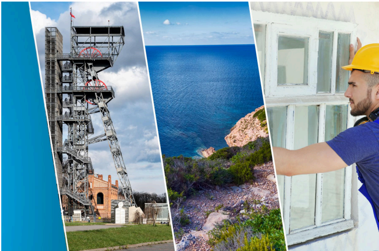
Bruxelles, 14 May