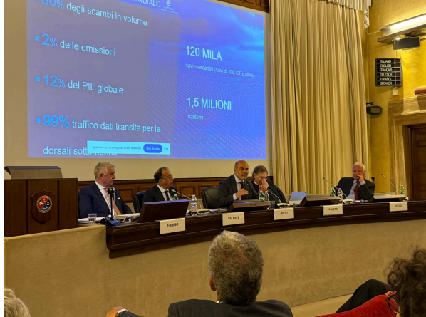
Roma, 16 maggio