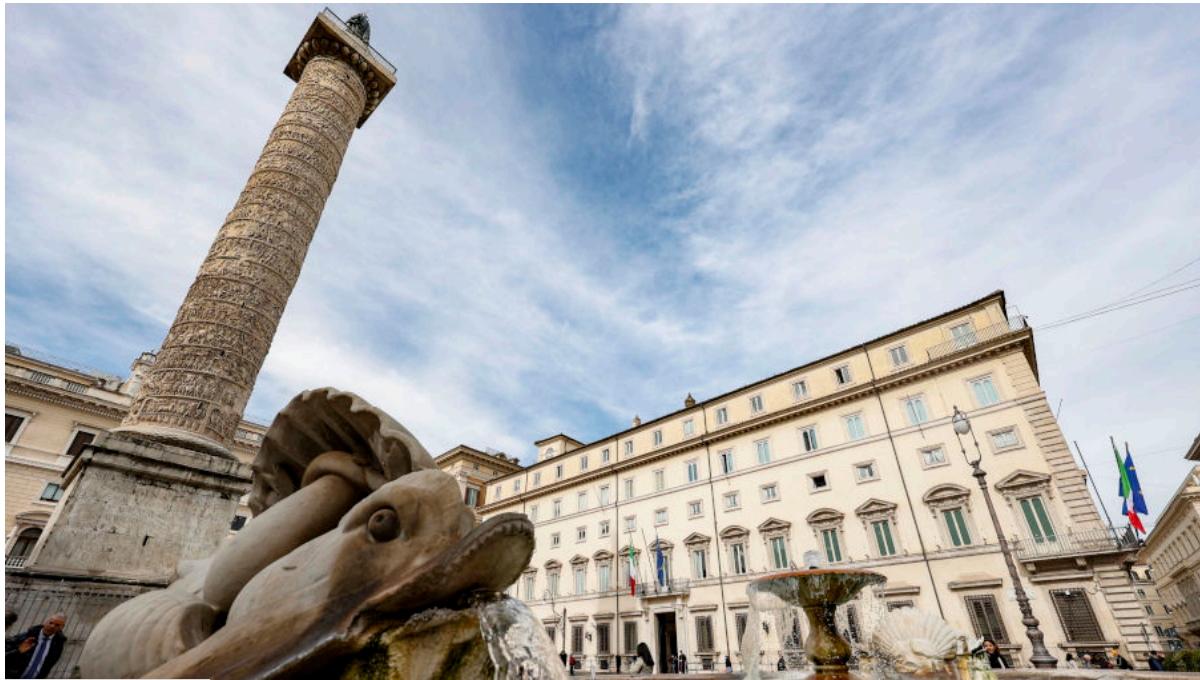
Roma, 4 giugno

“Un altro decisivo intervento a sostegno della competitività del Paese, che conferma la buona prassi avviata da questo Governo: si tratta infatti del terzo disegno di legge sulla concorrenza presentato dall’inizio del mandato, mentre, dal 2009 al 2023, provvedimenti analoghi erano stati approvati soltanto due volte in quattordici anni”. Lo ha dichiarato il ministro delle Imprese e del Made in Italy, sen. Adolfo Urso , commentando il provvedimento che ha ottenuto il semaforo verde dal Cdm, frutto di un costante confronto con la Commissione europea sugli obiettivi previsti dal PNRR ed il cui iter parlamentare dovrà necessariamente concludersi entro la fine dell’anno. “Quest’anno abbiamo puntato a migliorare l’efficienza dei servizi pubblici, il trasporto pubblico regionale e il trasferimento tecnologico alle imprese” , ha aggiunto Urso. “Con norme strategiche, come quella sulle Fondazioni per il trasferimento tecnologico, puntiamo a supportare l’innovazione, potenziare le filiere produttive e dare nuovo slancio alla crescita economica del Paese” ha precisato il Ministro.[...]