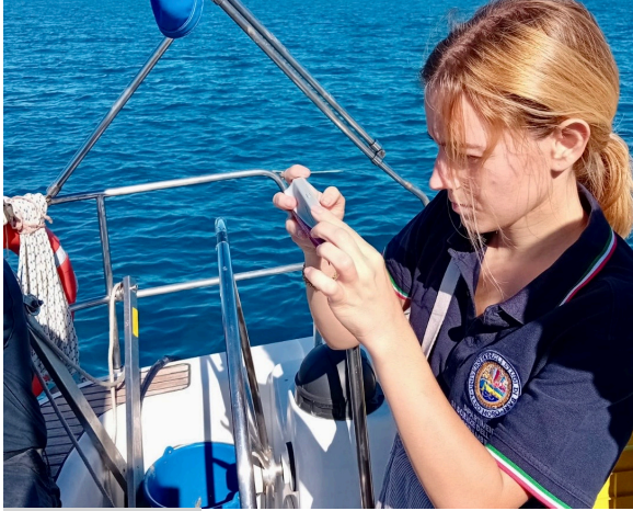
Bari, 5 giugno