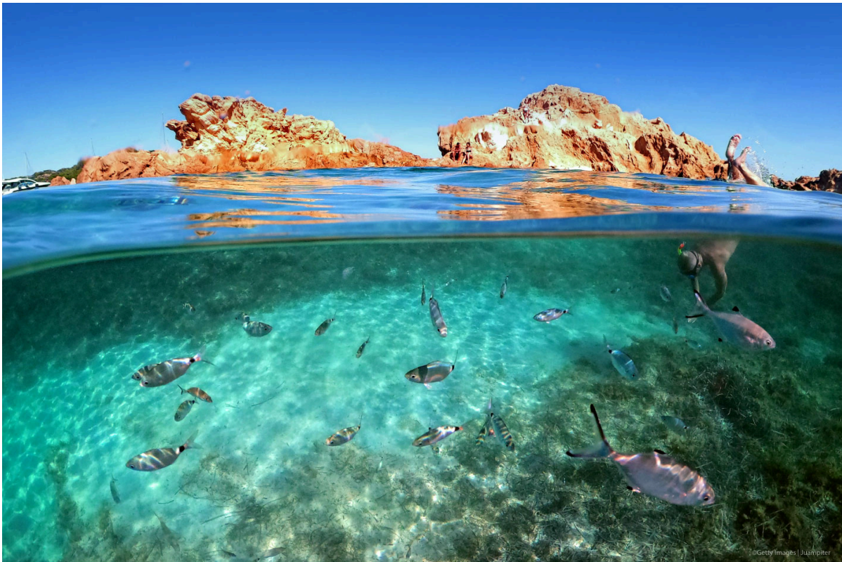
Brussels, 5 June

The ocean shapes our economies, our food systems, even the air we breathe. To better protect our ocean, the Commission has adopted a European Ocean Pact , which will help to promote a thriving blue economy and support the well-being of people living in coastal areas.