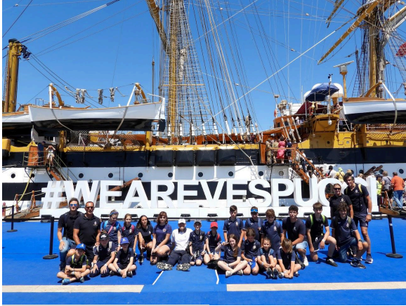
Civitavecchia, 2 giugno