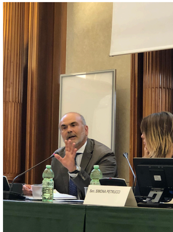
Roma, 7 luglio