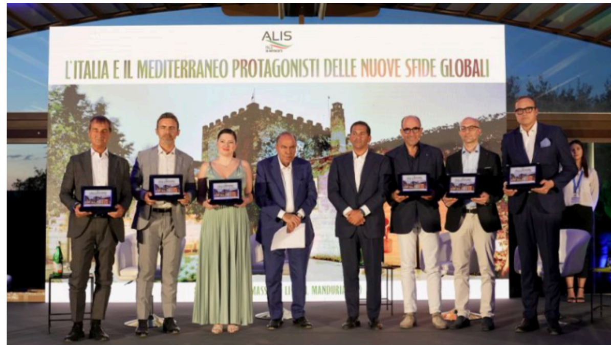
Manduria, 9 luglio