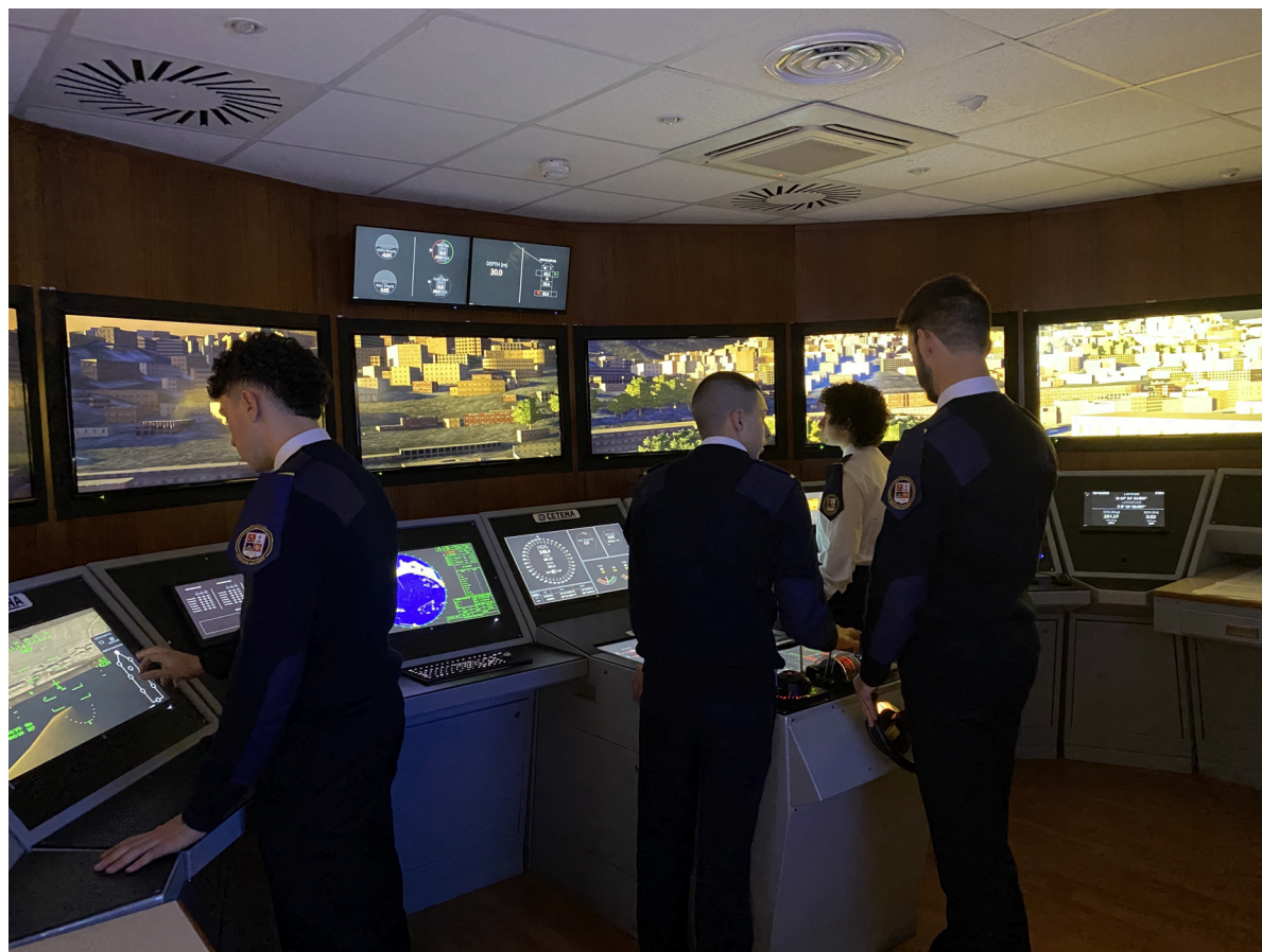
Genova, 23 Giugno

Sono oltre 300 le posizioni aperte nei 13 corsi ITS che la Fondazione Accademia Italiana della Marina Mercantile ha aperto venerdì 20 giugno, e che resteranno a disposizione fino all'inizio dell'autunno. L'intero ventaglio di opportunità del mondo della logistica sarà quindi a disposizione di chi voglia fare del mare e del trasporto di merci e passeggeri il proprio mondo e il proprio futuro. Tutti i corsi, disponibili su www.accademiamarinamercantile.it , sono gratuiti. Sono 4 le classi da "Allievo Ufficiale di Coperta" disponibili quest'anno, con la scadenza del bando prevista per il prossimo 8 settembre, con avvio del corso previsto tra ottobre e novembre 2025. Analoga la condizione per il corso da "Allievo Ufficiale di Macchina", che quest'anno vede l'apertura di 2 nuove classi, sempre da 25 posti disponibili [...].