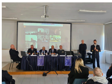
Molfetta, 14 novembre