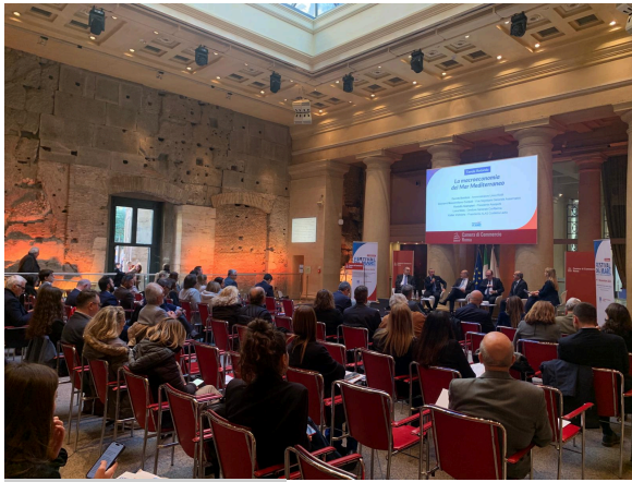
Roma, 11 novembre