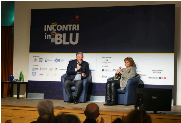
Genova, 13 novembre