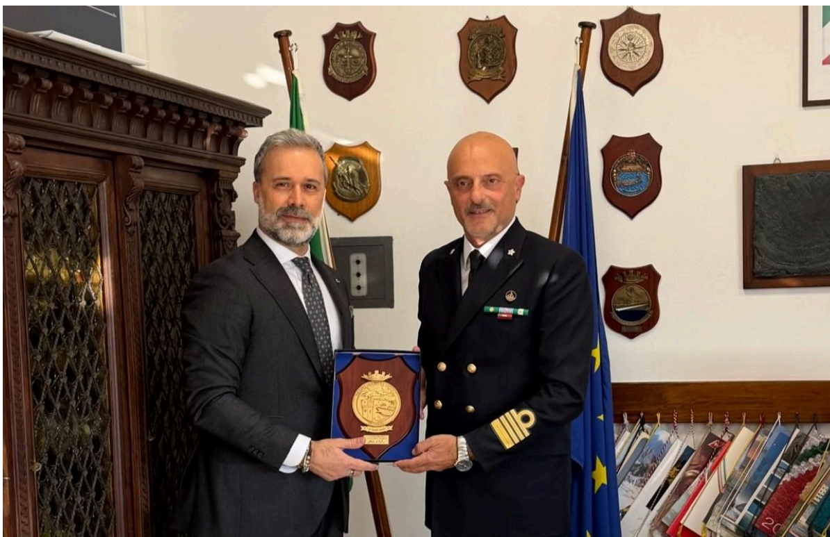
Savona, 12 dicembre