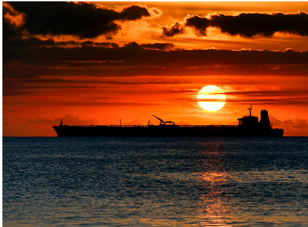
Nairobi, 2-5 December

The International Maritime Organization (IMO) reaffirmed its commitment to strengthening maritime security across the Red Sea, East Africa, Southern Africa and the Western Indian Ocean regions during the EU Regional Maritime Security Week , held in Nairobi, Kenya (2 - 5 December 2025).