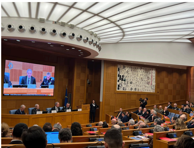
Roma, 15 dicembre