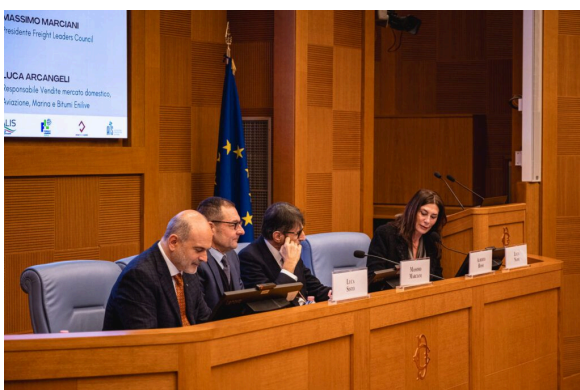
Roma, 11 febbraio