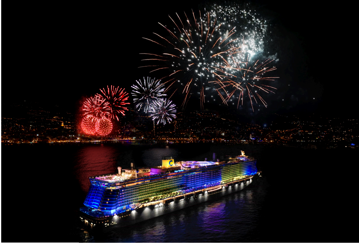
Genova, 12 febbraio

Per il quinto anno consecutivo, Costa Crociere conferma la sua partnership con il Festival di Sanremo , rinnovando un sodalizio che continua a evolvere, integrando in modo originale e innovativo la grande musica italiana con il fascino del viaggio.