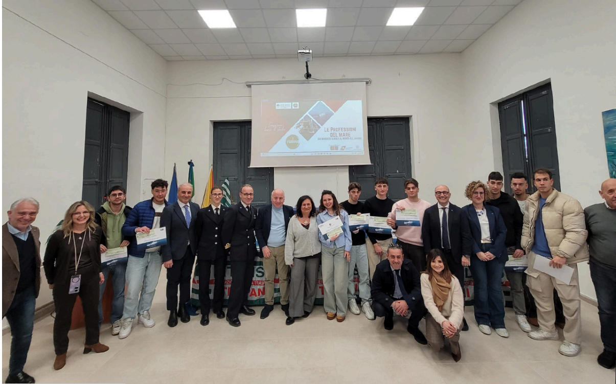
Trapani, 6 febbraio

Giovani, opportunità e futuro al centro della cerimonia svoltasi ieri mattina nell'Aula Magna dell'Istituto di Istruzione Superiore "L. Da Vinci – Torre" di viale Regina Elena, a Trapani, durante la quale sono state consegnate le borse di studio Caronte & Tourist a quindici neodiplomati distintisi per merito negli anni scolastici 2023/24 e 2024/25.