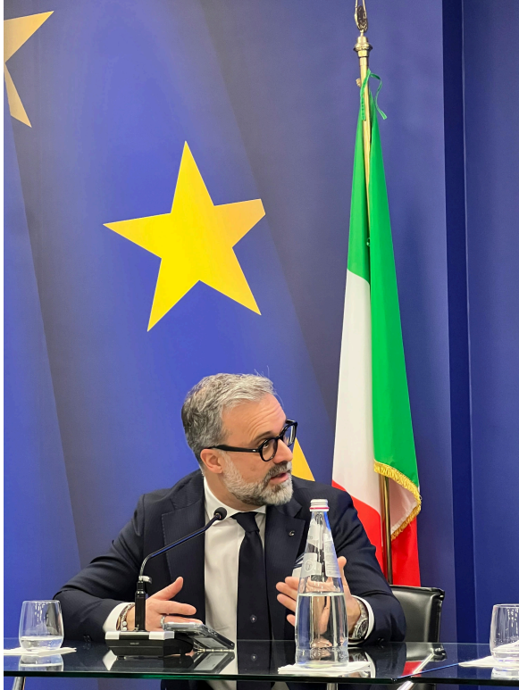
Roma, 16 febbraio