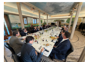
Ravenna, 5 febbraio

Si è svolto a Ravenna il primo Consiglio Generale di Confitarma del nuovo anno.