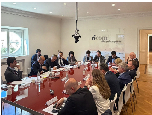
Roma, 27 aprile