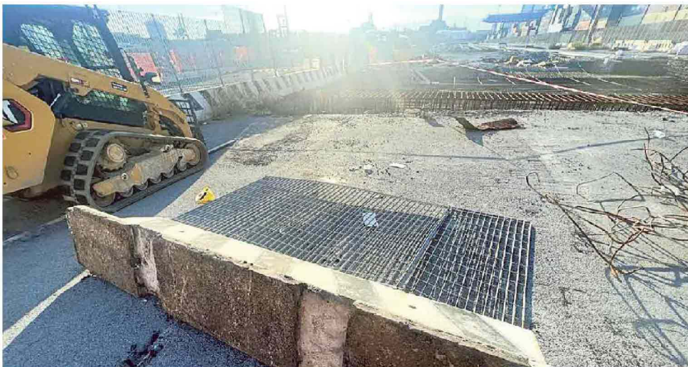
Il new jersey abbattuto e, a sinistra, il mezzo da lavoro che è stato sequestrato